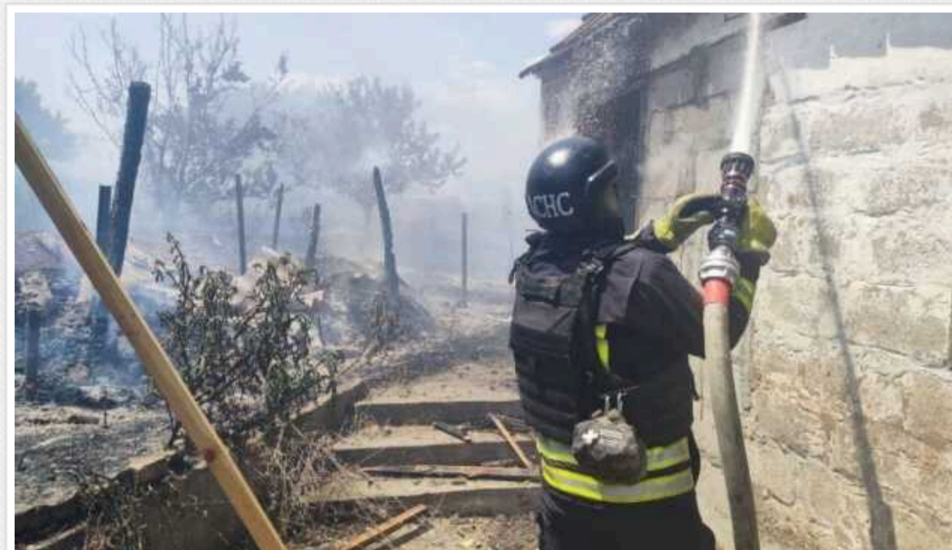
Окупанти понад 20 разів обстріляли Нікопольщину: є поранена

Унаслідок ворожих обстрілів Нікопольського району Дніпропетровщини постраждала 18-річна дівчина.