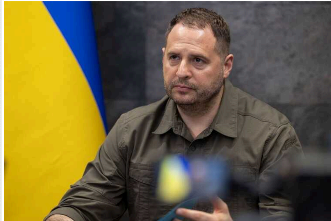
Єрмак розкритикував західні грантові організації, звинувативши у підіграванні російським нарративам

Глава Офісу президента Андрій Єрмак виступив із критикою пов'язаних із західними посольствами грантових організацій, звинувативши їх фактично у підіграванні російським нарративам про Україну як «найкорумпованішу країну світу».