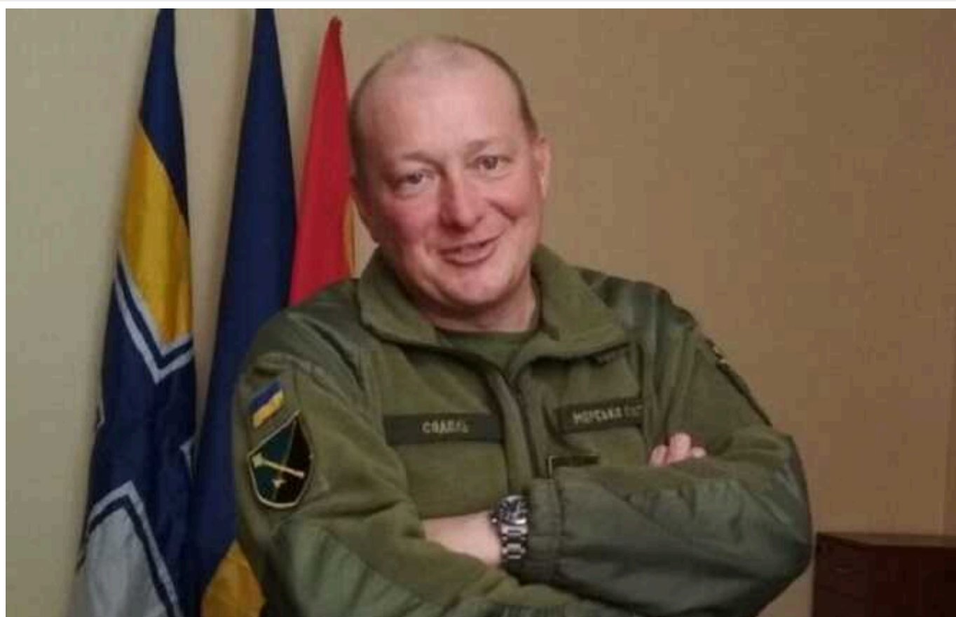
Скандал з генералом ЗСУ: ЗМІ розповіли, за що звільнили Юрія Содоля

Президент України Володимир Зеленський змінив командувача Об'єднаних сил ЗСУ Юрія Содоля на бригадного генерала Андрія Гнатова. Це сталося після ряду скандальних заяв у бік генерала. Зокрема, депутатка Мар'яна Безугла заявила, нібито генерал Юрій Содоля у час, коли російські війська проривалися на Торецьк, перебував в Одесі й нагороджував мера міста Труханова.