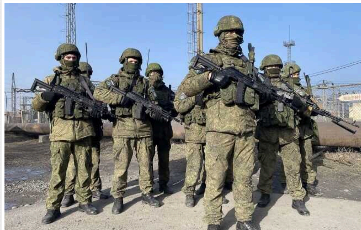
Окупанти заблоковані на агрегатному заводі у Вовчанську. – ЗСУ

Російські окупанти залишаються заблокованими на агрегатному заводі у Вовчанську Харківської області. Загарбники намагаються туди пробитися.