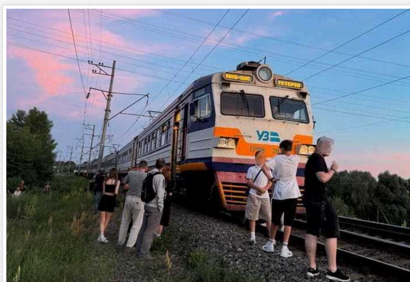
У Бучі електричка травмувала 14-річного хлопця

Поблизу Бучі Київської області електричка травмувала 14-річного місцевого жителя. Машиніст потяга, побачивши на колії підлітка, намагався уникнути наїзду, застосувавши екстрене гальмування, але наїзду уникнути не вдалося.