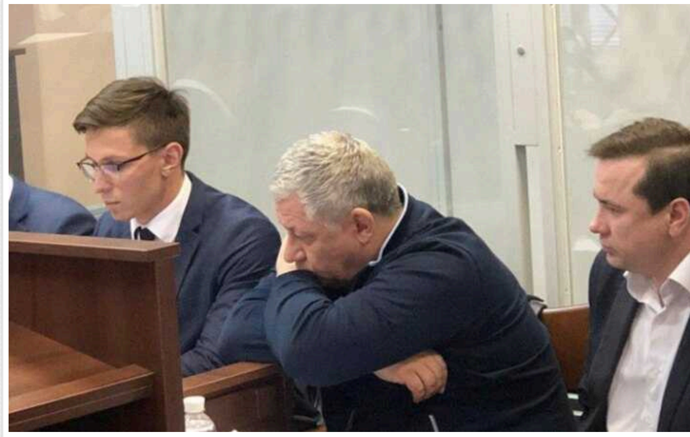
Суд виніс вирок ексчиновнику Генпрокуратури Щербині, який вимагав хабаря для директора ДБР

Вищий антикорупційний суд визнав винним кума колишнього директора Державного бюро розслідувань Романа Труби, ексначальника Головного слідчого управління Генеральної прокуратури Ігоря Щербину та засудив його до 6 років позбавлення волі з конфіскацією майна.