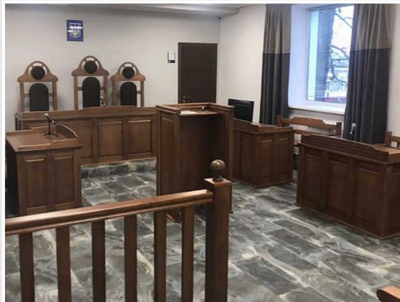
На Київщині судитимуть водія, який п'яним влаштував ДТП

У Київській області судитимуть водія, який спричинив ДТП з трьома постраждалими, зокрема неповнолітнім. Під час аварії порушник перебував за кермом у стані алкогольного сп'яніння.