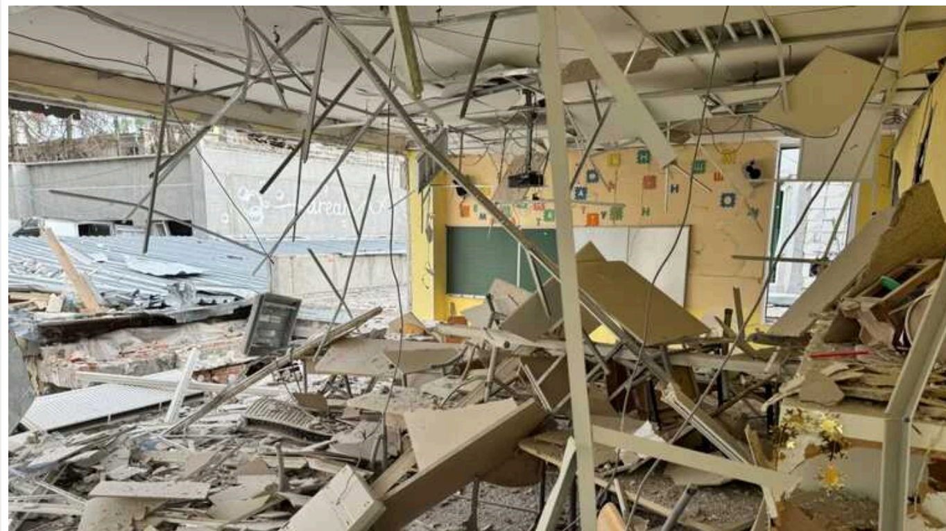
Загарбники вперше запустили по Харкову модифікований КАБ-250, – ОВА