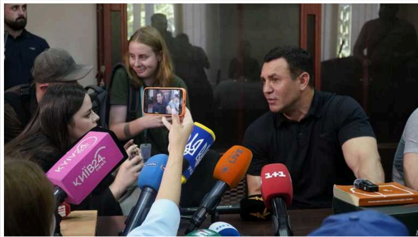
На нардепа Тищенка одягли електронний браслет не відразу після суду: він встиг "засвітитися" у ресторани, – соцмережі

На народного депутата Миколу Тищенка одягнули електронний браслет не одразу після суду – до цього він встиг "засвітитися" в одному з ресторанів.