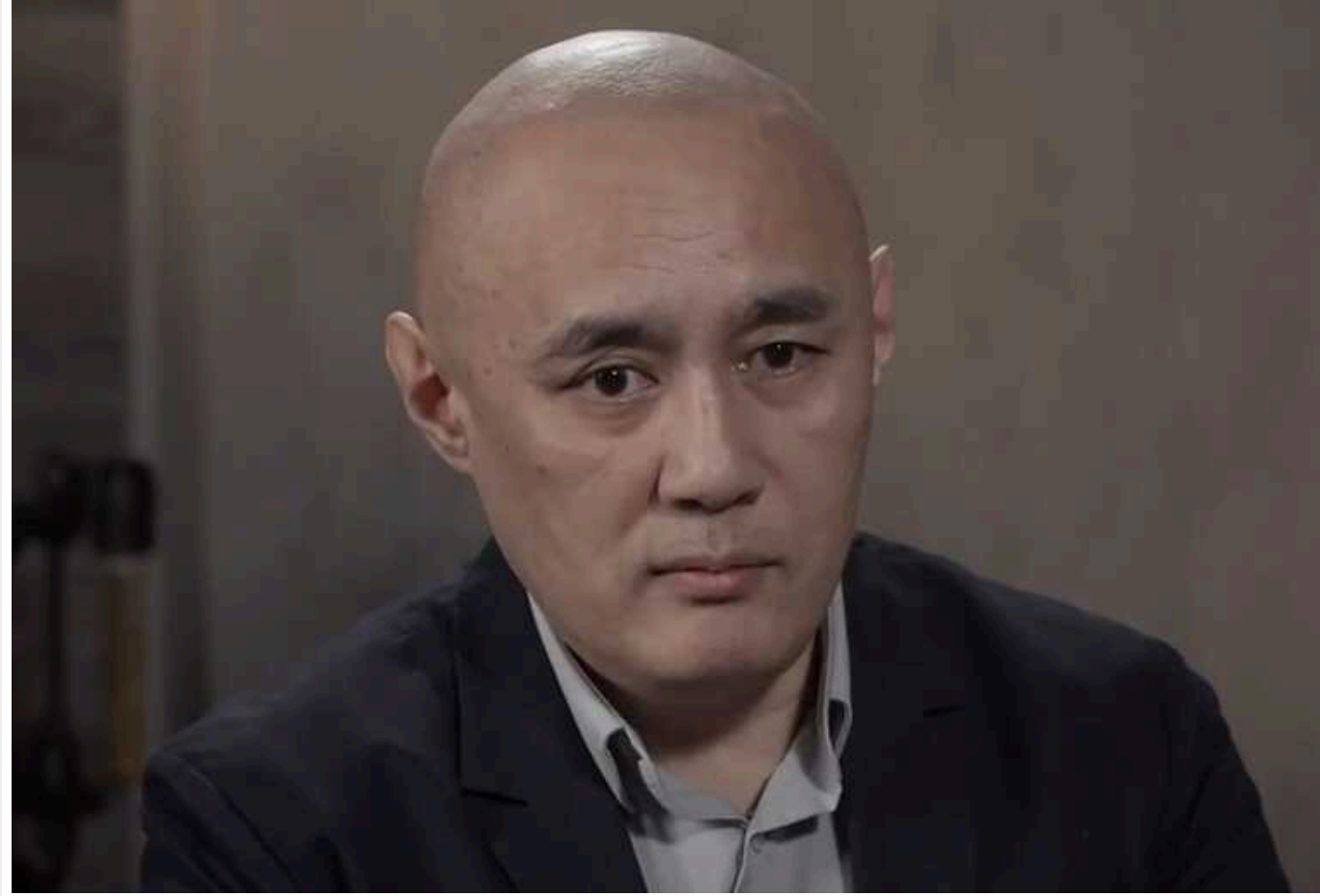
ОГП хоче вимагати від Казахстану екстрадиції двох його громадян, яких підозрюють у замаху на опозиціонера Садикова

Офіс генпрокурора України хоче вимагати від Казахстану екстрадиції двох його громадян, яких підозрюють у замаху на казахстанського опозиціонера Садикова, який живе в Києві.