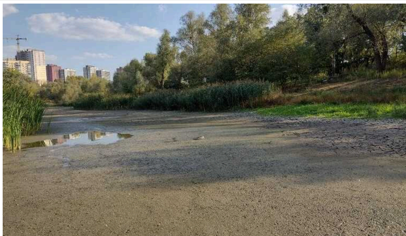
БЕБ заблокувало у Києві розчищення озера Синє

25 червня 2024 року КП “Плесо” вчергове оголосило тендер на розчистку озера Синє на столичному масиві Виноградар. Вартість питання – 96,35 млн гривень. Це вже третій тендер по Синьому в цьому році. Перший відмінили через “відсутність учасників”, другий скасовано за листом Київського територіального управління Бюро економічної безпеки (БЕБ). На думку аналітиків БЕБ, переможець тендеру не відповідає кваліфікаційним вимогам та повідомив про себе недостовірні дані. В БЕБ стверджують, що такими чином убезпечили міський бюджет від неефективного використання понад 79 млн гривень.