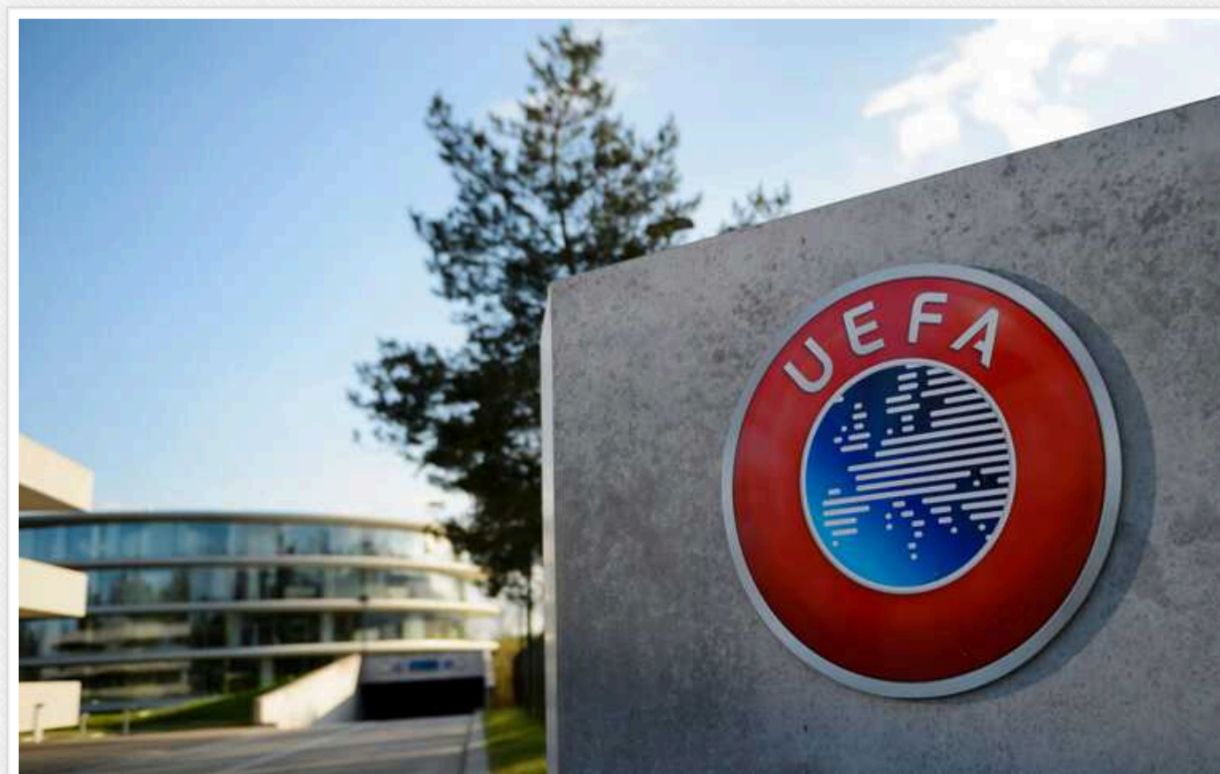
УЄФА запровадив заборону для України на Євро-2024