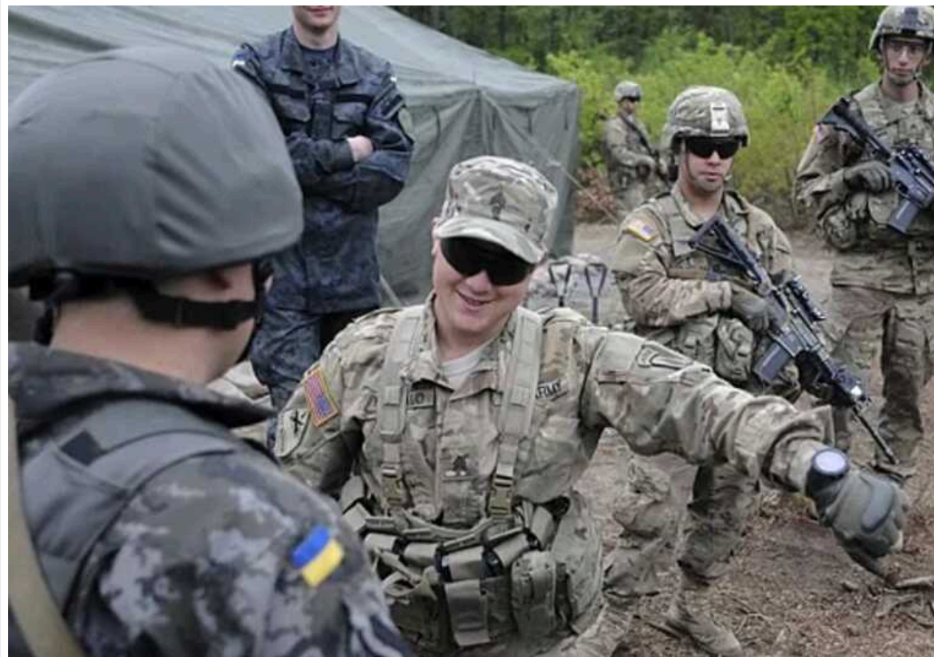
CNN: США працюють над зняттям заборони на відправлення військових інструкторів в Україну

У Білому домі працюють над тим, щоб зняти заборону на відправлення військових інструкторів в Україну. Наразі адміністрація Байдена рухається у тому, щоб отримати згоду президента Сполучених Штатів.