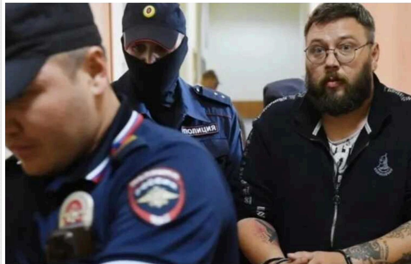
У РФ ексменеджера медіаструктур Пригожина кинули за ґрати