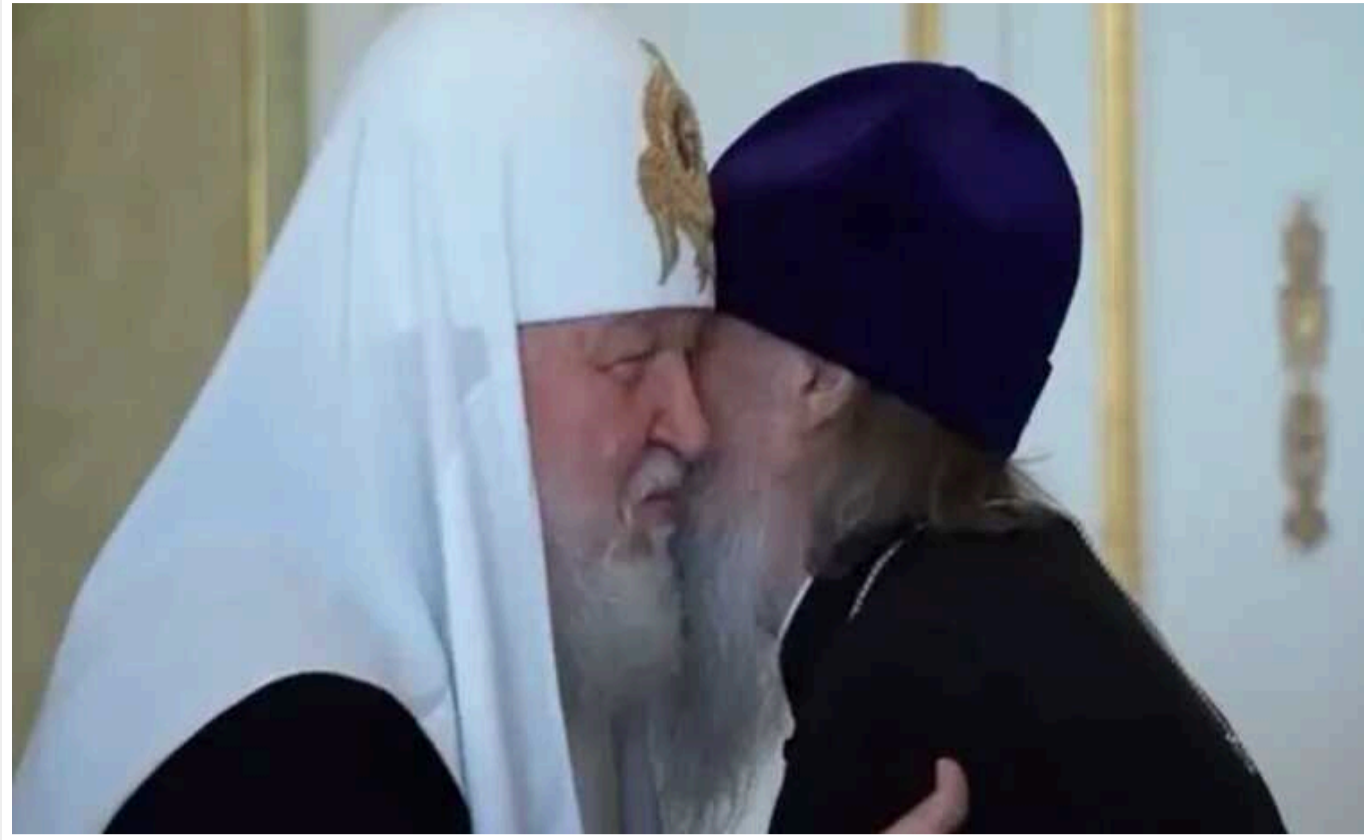
Митрополит УПЦ МП, якого обміняли на військовополонених ЗСУ, отримав орден від Гундяєва

Засуджений в Україні на 5 років позбавлення волі за виправдання збройної агресії РФ архиєрей УПЦ МП, митрополит Тульчинський і Брацлавський Іонатан (Анатолій Єлецьких) через обмін полоненими прибув до Росії. 25 червня він зустрівся з очільником російської православної церкви патріархом Кирилом (Володимир Гундяєв) і отримав з його рук нагороду – орден Сергія Радонезького.