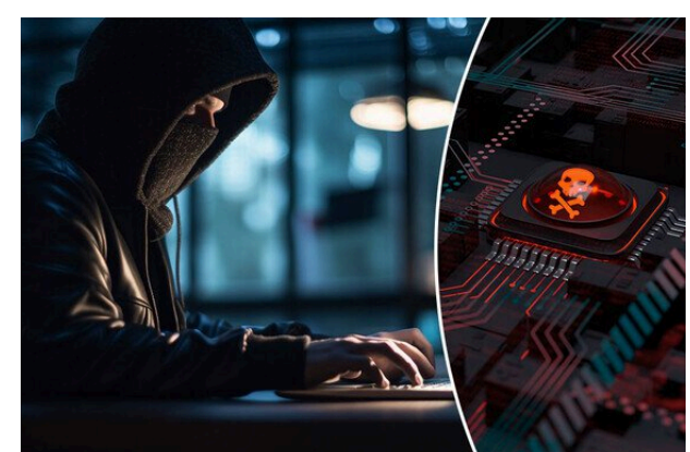
18-річний українець злавав американський онлайн-магазин: тисячі жертв...