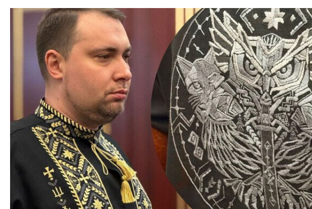
Кирило Буданов одягнув унікальну вишиванку, яку створили сотні людей