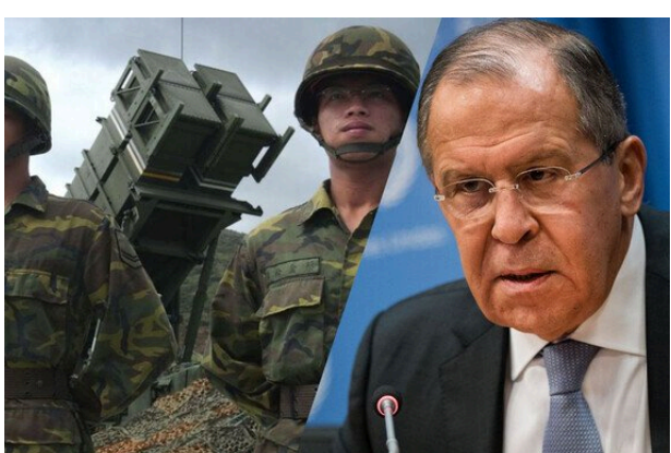
Росія намагається втягнути Азію у гібридну війну проти Заходу, - ЦПД