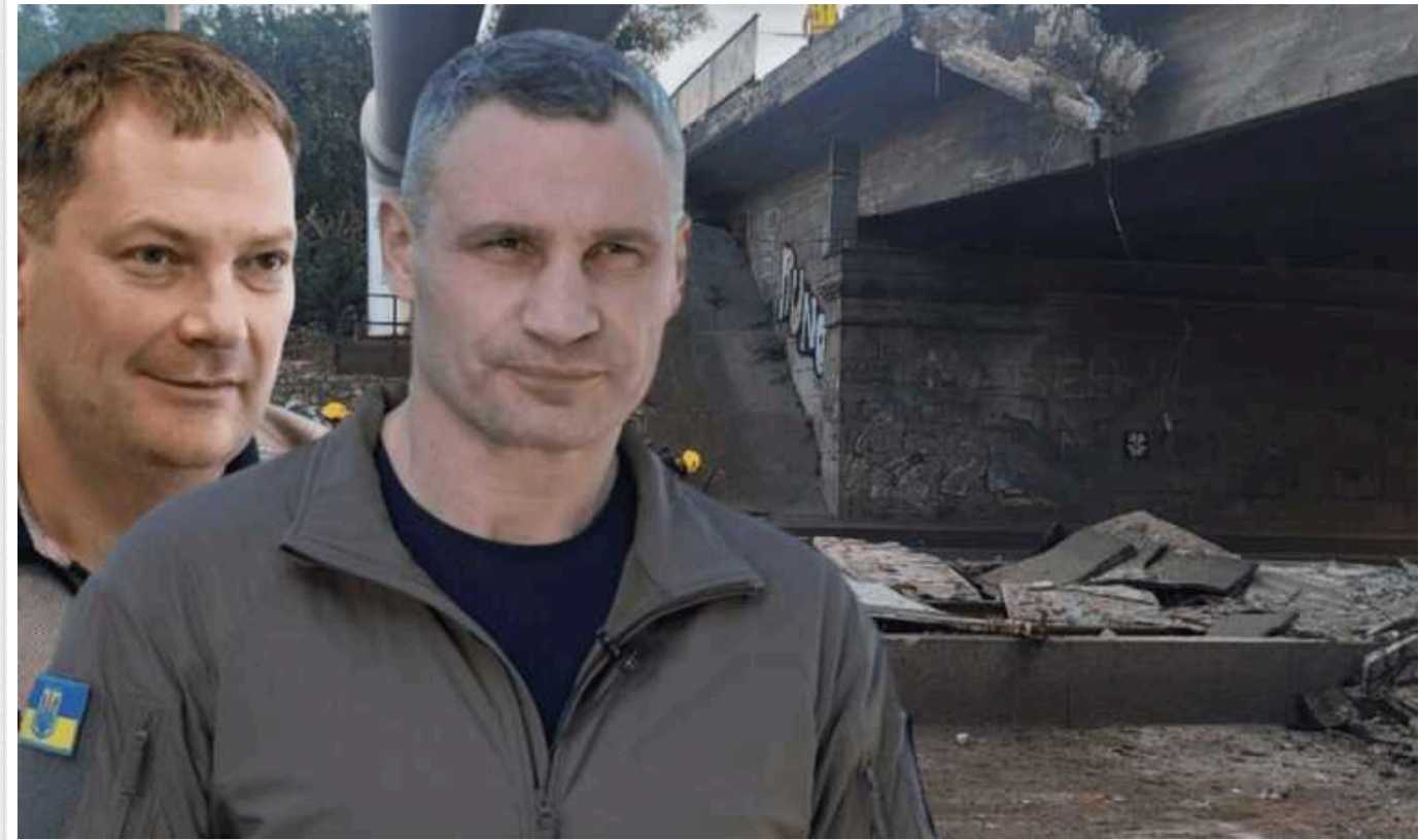
Обвалення Повітрофлотського шляхопроводу: як часто обстежували та ремонтували об'єкт

Життя столиці продовжує вражати своєю різнобарвністю: поки в одному її районі відкривають новий пішохідний міст, в іншому – на очах розсипається старий, занедбаний Повітрофлотський шляхопровід. Фахівці КП "Київавтошляхміст" планово оглядали цю споруду восени минулого року і її особливих нарікань до її стану не мали.