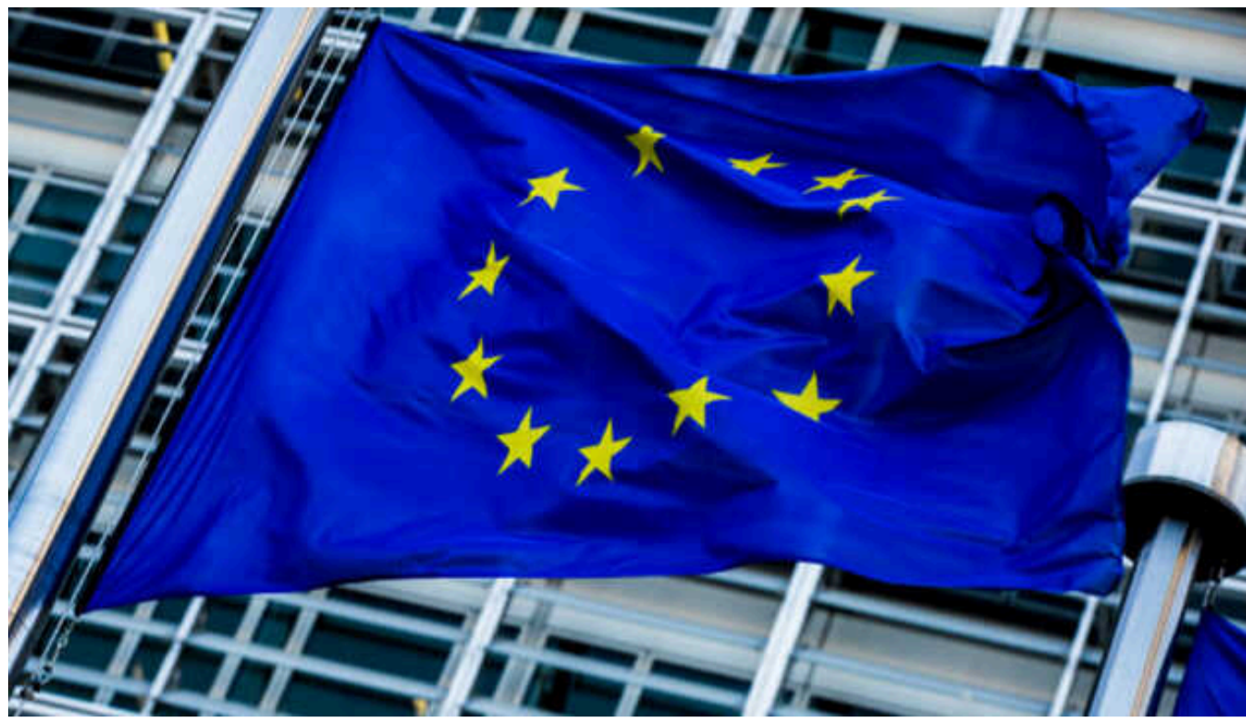
Рада ЄС у вівторок затвердить текст безпекової угоди з Україною, - ЗМІ

Рада ЄС має затвердити текст безпекової угоди між Україною і ЄС у вівторок, 25 червня.