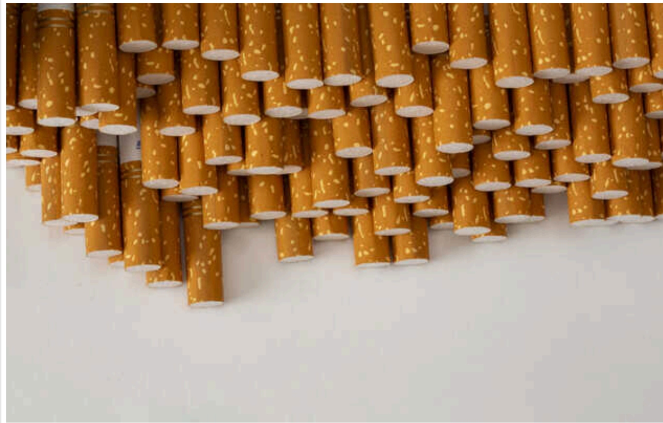
Чому БЕБ не бачить контрафактне виробництво цигарок Marlboro у Тернополі?

Бюро економічної безпеки тупо не помічає, як у Тернополі продовжує активно працювати тіньова тютюнова фабрика.