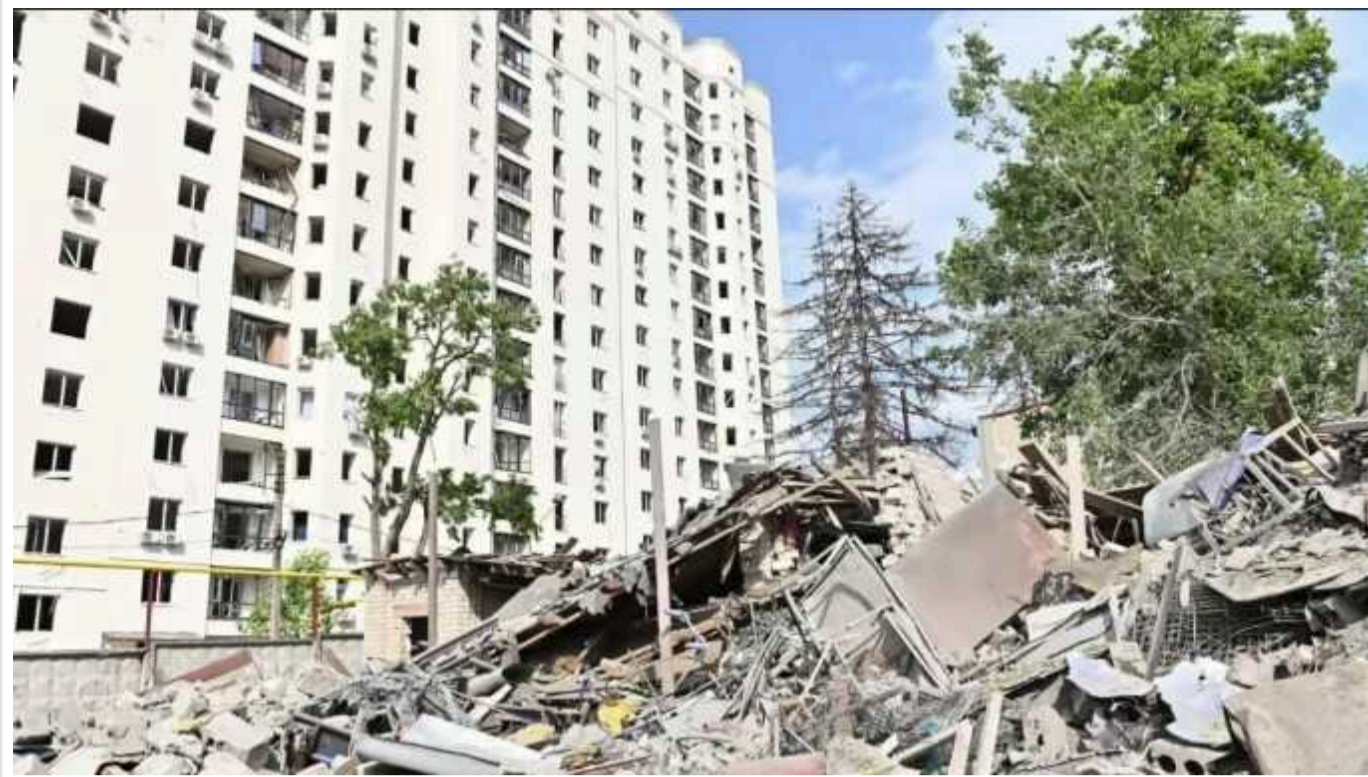
В Харківській ОВА розповіли про стан поранених: на лікуванні залишаються 20 людей

Після ворожих обстрілів Харкова 22 та 23 черня у лікарнях залишаються на лікуванні 20 людей.