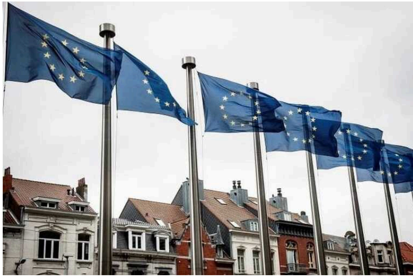
Євросоюз ухвалив 14-й пакет санкцій проти РФ

Крайні Європейського Союзу офіційно ввели 14-й пакет санкцій проти Росії, повідомила у понеділок Рада ЄС.