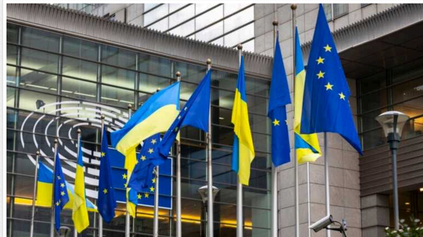
У ЄС зуміли досягти остаточної домовленості щодо використання доходів від заморожених активів РФ

Глава МЗС Бельгії Хаджа Лабіб заявила, що країни ЄС зуміли досягти остаточної домовленості щодо використання доходів від заморожених російських активів.