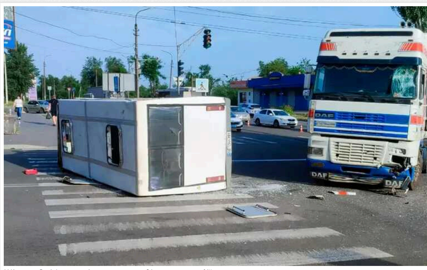
У Кривому Розі фура влетіла в маршрутку: 21 пасажир та водій отримали травми

Вранці 24 червня у Кривому Розі сталася дорожно-транспортна пригода за участю пасажирського автобуса та вантажівки. Внаслідок аварії десятки людей отримали травми різного ступеня тяжкості.