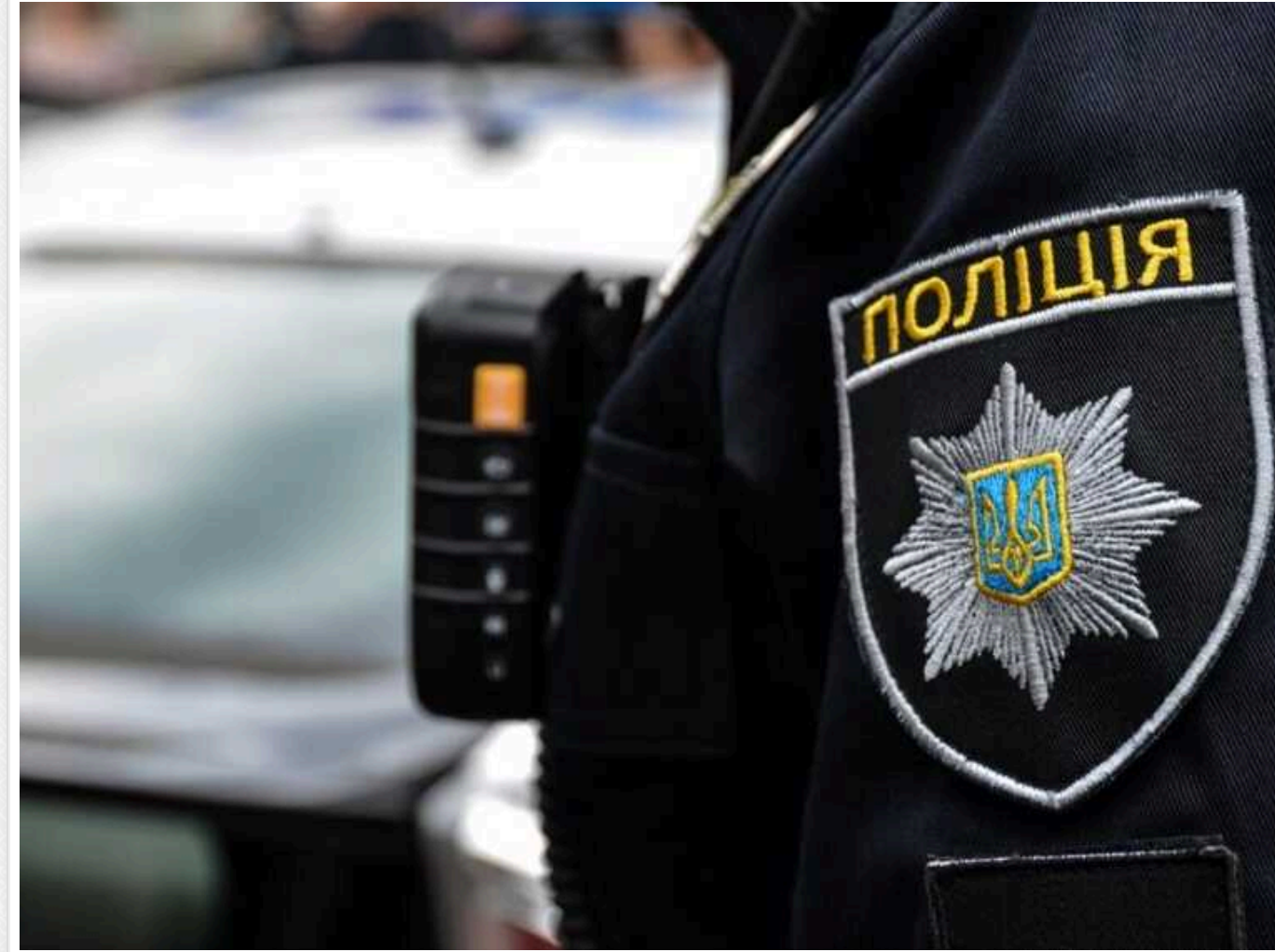
У центрі Києва п'яний молодик намагався влаштувати бійку із відвідувачами кафе

У центрі Києва на вулиці Хрещатик чоловік почав чіплятись до відвідувачів кафе та намагався влаштувати бійку. Хулігана оперативно заспокоїли правоохоронці та доставили до райвідділу.