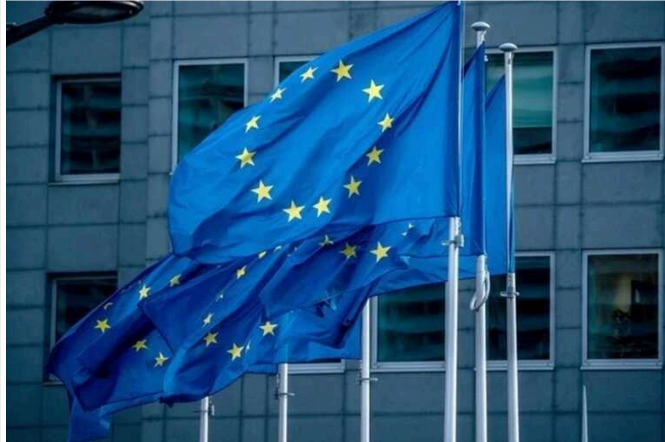
У ЄС розробили механізм обходу вето Угорщини на купівлю зброї Україні за рахунок активів РФ

Європейський Союз розробив юридичний обхідний шлях, щоб обійти вето Угорщини на купівлю зброї для України за рахунок прибутку, отриманого від заморожених активів Росії цього року.