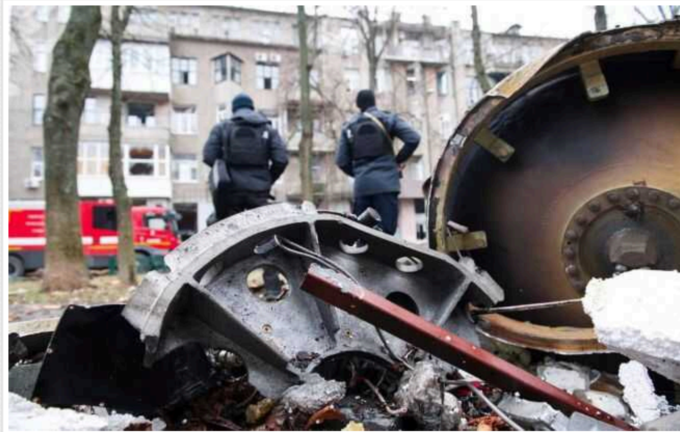
У Харкові після ударів РФ зросла кількість поранених: половина міста залишилась без світла

Внаслідок ворожого авіаційного удару по цивільних об'єктах Шевченківського та Холодногірського районів Харкова поранені 10 людей. Половина міста - без електропостачання внаслідок атаки РФ.