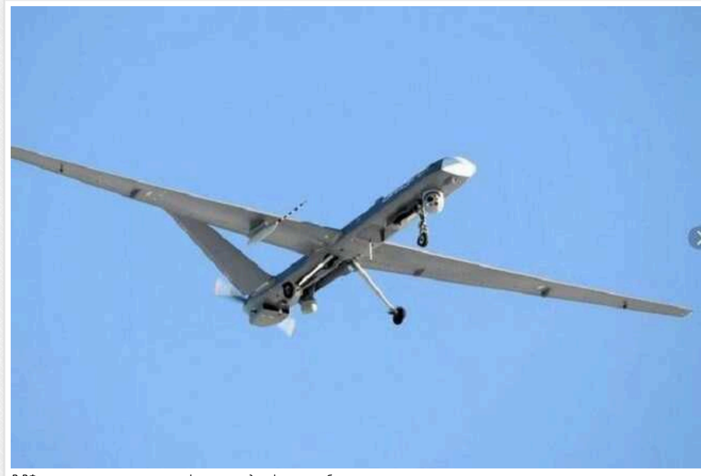
В РФ поскаржилися на масовану нічну атаку дронів: чули вибухи

У ніч проти 23 червня на території країни-агресора Росії прозвучила серія вибухів. Чинovníки заявили, що кілька областей були під атакою безпілотників.