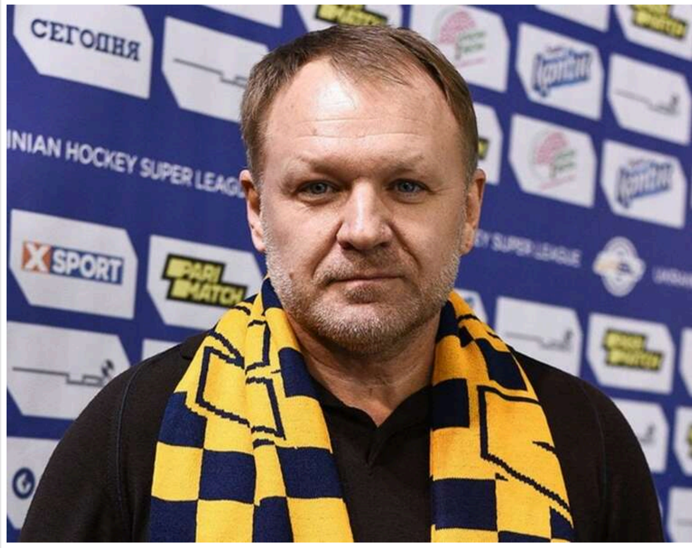
Суд відмовив компанії Кропачова в стягненні 3 мільярдів гривень з ДП «ВК "Краснолиманська"»

Господарський суд Донецької області відхилив позов ТОВ «Краснолиманське», пов'язаного з обвинуваченням у корупції Віталієм Кропачовим, про стягнення 3,012 млрд грн з ДП «Вугільна компанія "Краснолиманська"».