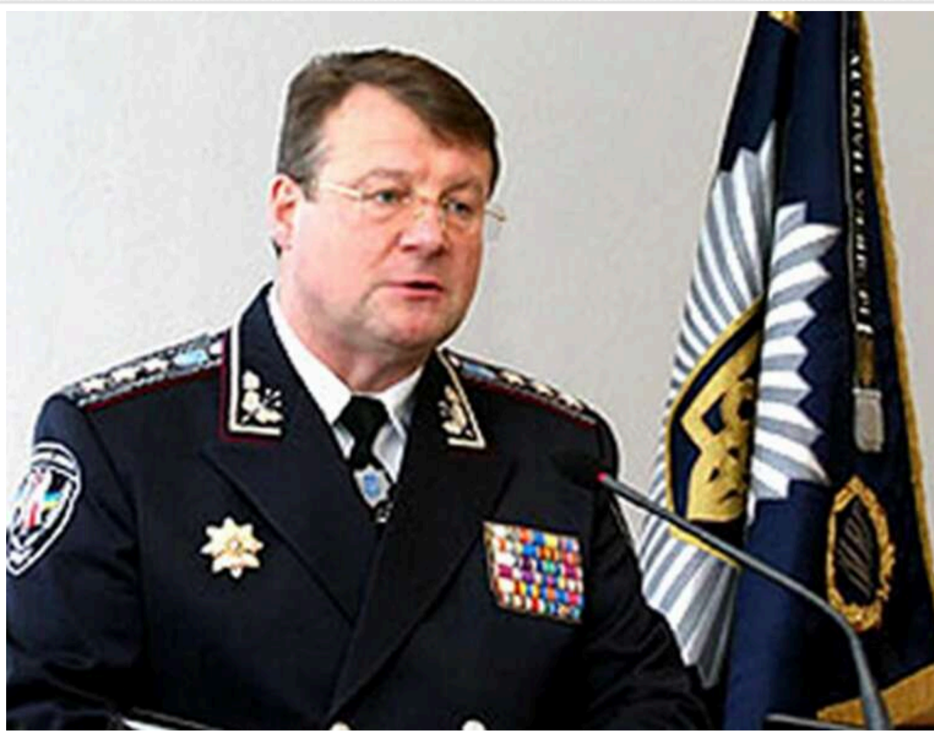
У Польщі затримали ексзаступника міністра внутрішніх справ України Володимира Бедриківського за підозрою у шпигунстві, - ЗМІ

У Польщі затримали 62-річного уродженця Заліщиків на Тернопільщині – колишнього високопоставленого українського силовика, генерал-полковника міліції у відставці Володимира Бедриківського.