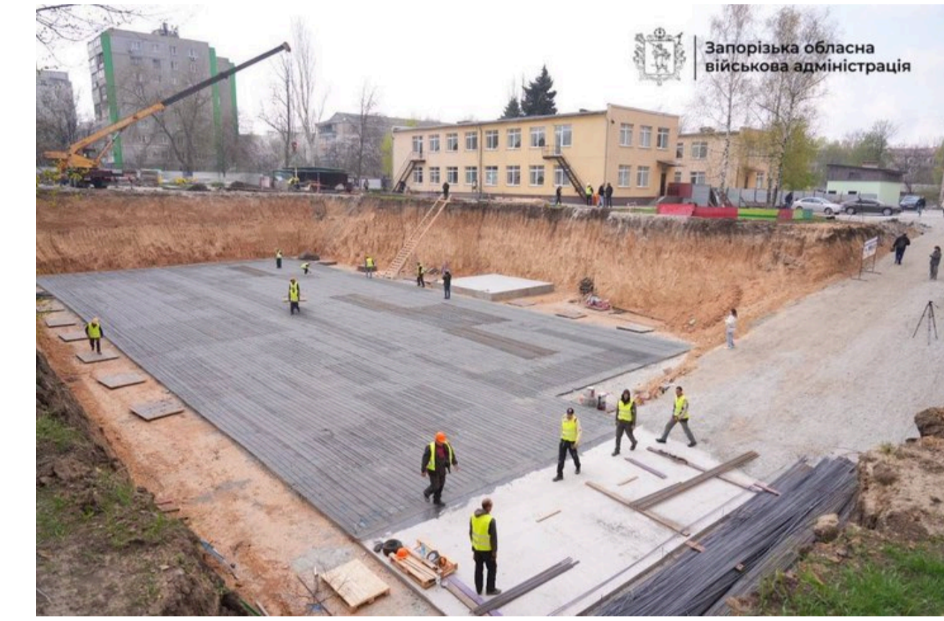
Будівництво протирадіаційного укриття закладу дошкільної освіти «Трайлик» у Запоріжжі.