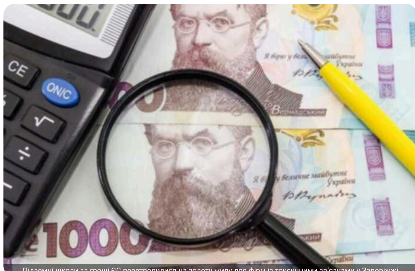
Підземні школи за гроші ЄС перетворилися на золоту жилу для фірм із токсичними зв'язками у Запоріжжі

У Запоріжжі цього року планують збудувати чотири підземні школи та чотири дитячі садки загальною вартістю понад 1 мільярд гривень за кошти Єврозонозу в межах програми Ukraine Facility. Усі підряди, за кількісною інформацією, отримали три компанії, які мають ознаки взаємозв'язку між собою.