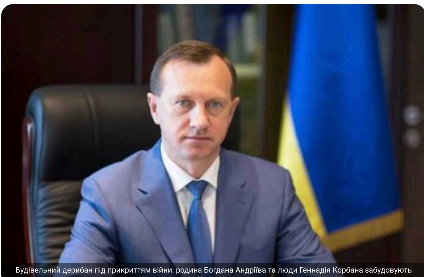
Будівельний дерибан під прикриттям війни: родина Богдана Андріїва та люди Геннадія Корбана будують Ужгород

Родина міського голови Ужгород Богдан Андріїв після початку повномасштабного вторгнення активувала діяльність у сфері забудови міста. За даними журналістів, у співласності колишньої дружини та сина мера перебувають кілька компаній, що займаються будівництвом житлових комплексів бізнес-класу. Один із проєктів, як стверджується, реалізується у партнерстві з оточенням Геннадій Корбан, якого президент Володимир Зеленський у 2022 році позбавив українського громадянства.