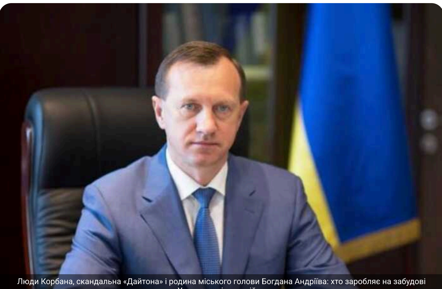
Люди Корбана, скандальна «Дайтона» і родина міського голови Богдана Андрієва: хто заробляє на забудові Ужгорода під час війни

Родина міського голови Ужгород Богдан Андрієв після початку повномасштабного вторгнення активувала діяльність у сфері забудови міста. За даними журналістів, у співласності колишньої дружини та сина мера перебувають кілька компаній, що займаються будівництвом житлових комплексів бізнес-класу. Один із проєктів, як стверджується, реалізується у партнерстві з оточенням Геннадій Корбан, якого президент Володимир Зеленський у 2022 році позбавив українського громадянства.