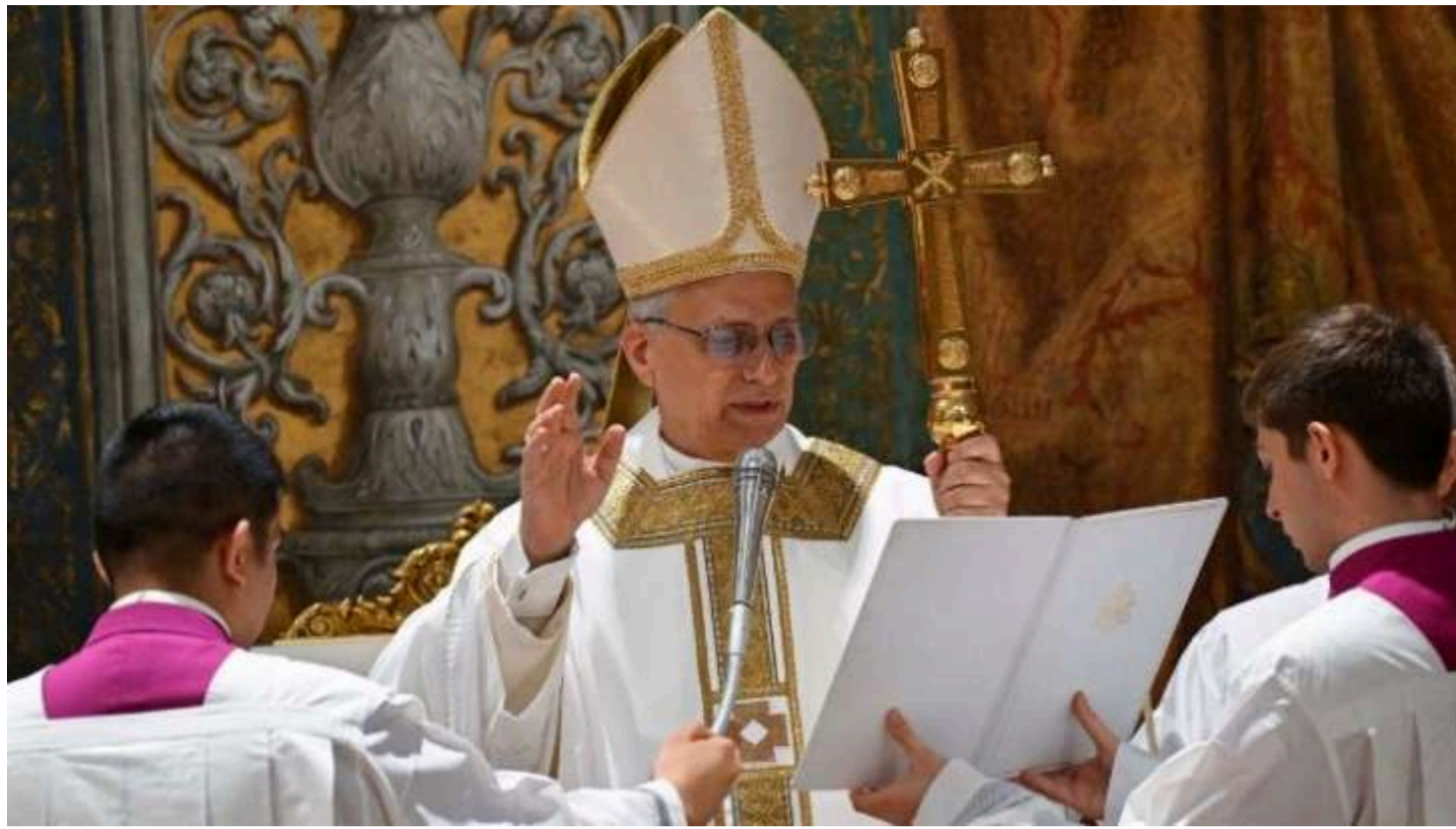
Ілюстративне фото з відкритих джерел

Папа Римський Лев XIV опублікував першу велику енцикліку (офіційне послання папи римського до вірян і всього світу) Magnifica humanitas (Чудове людство) під заголовком "Про захист людини за часів штучного інтелекту". У своєму посланні він закликав світові уряди уповільнити розвиток штучного інтелекту (artificial intelligence – AI) та жорстко регулювати цю сферу.