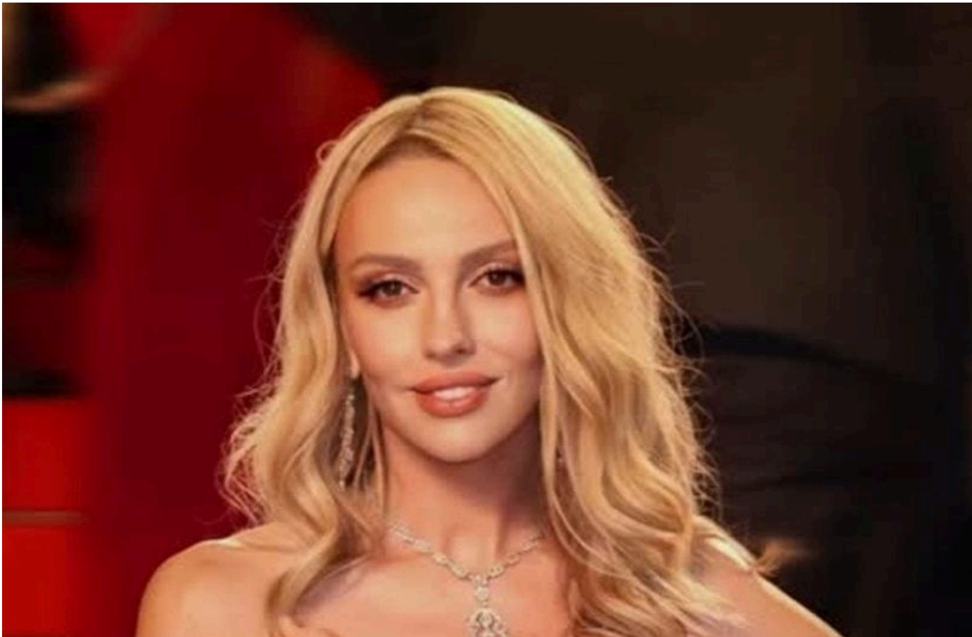
Оля полякова

СТЕПАНЕНКО ГРИГОРІЙ — 26 Травня 2026, 14:24 ⌚ 1 Min Read — ГЛАМУР