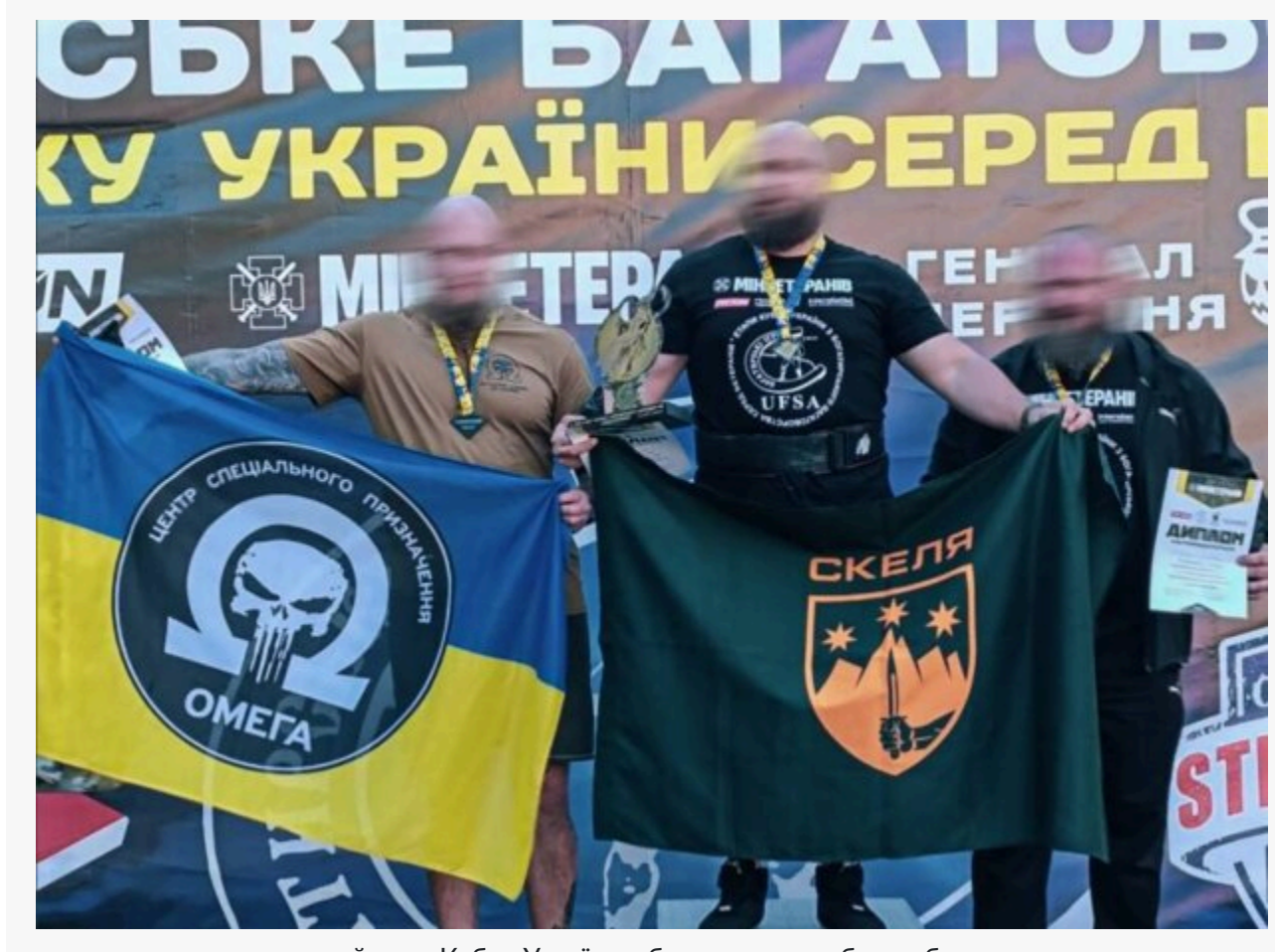
другий етап Кубка України з богатирського багатоборства

У Борисполі відгримів другий етап Кубка України з богатирського багатоборства.