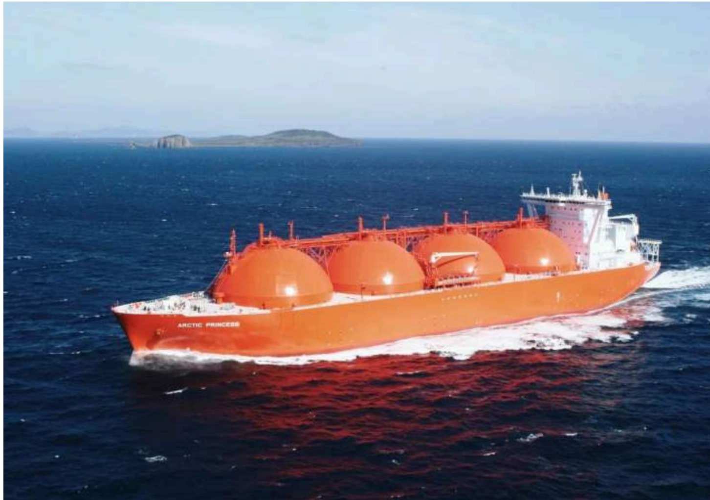
Фото: Танкер зрідженого природного газу (LNG)

Ціни на природний газ у Європі продовжили падіння на тлі очікувань можливої домовленості між США та Іраном. Угода може сприяти відновленню роботи Ормузької протоки – ключового маршруту світових енергопостачань. Про це повідомляє Bloomberg .