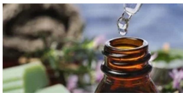
САМОЛІКУВАННЯ МОЖЕ БУТИ ШКОДИВИМ ДЛЯ ВАШОГО ЗДОРОВ'Я