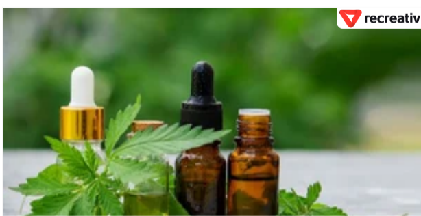
САМОЛІКУВАННЯ МОЖЕ БУТИ ШКОДИВИМ ДЛЯ ВАШОГО ЗДОРОВ'Я

Значно посилює ерекцію та рівень тестостерону