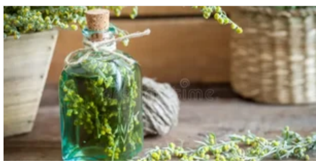
САМОЛІКУВАННЯ МОЖЕ БУТИ ШКОДИВИМ ДЛЯ ВАШОГО ЗДОРОВ'Я