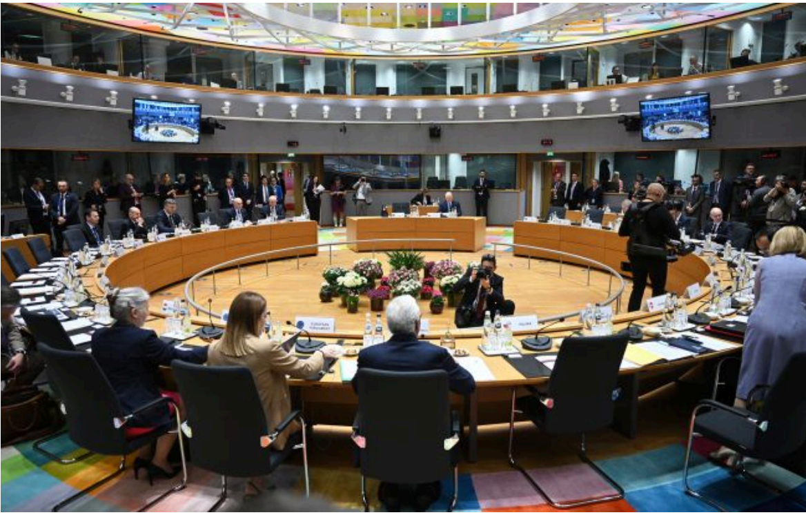
Фото: чому ЄС не може обрати переговорника з Росією