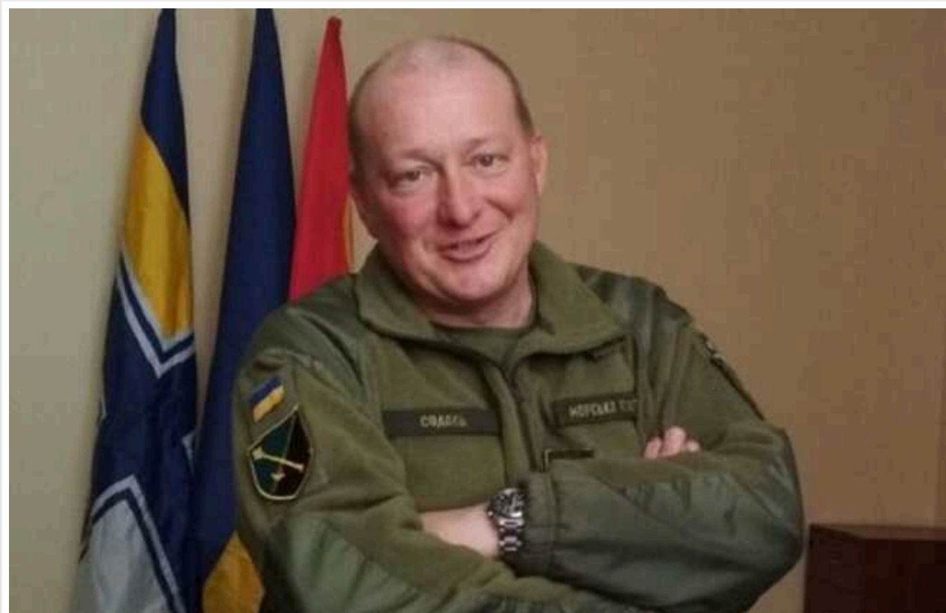
Безугла звинуватила генерала Содоля у прориві ЗС РФ біля Торецька: він нібито відпочивав в Одесі

Командувач Об'єднаними силами, на думку народної депутатки, припустився низки стратегічних помилок щодо захисту позицій ЗСУ. Під час прориву ЗС РФ на цій ділянці фронту він нібито відпочивав із друзями у ресторани, заявляє Мар'яна Безугла.