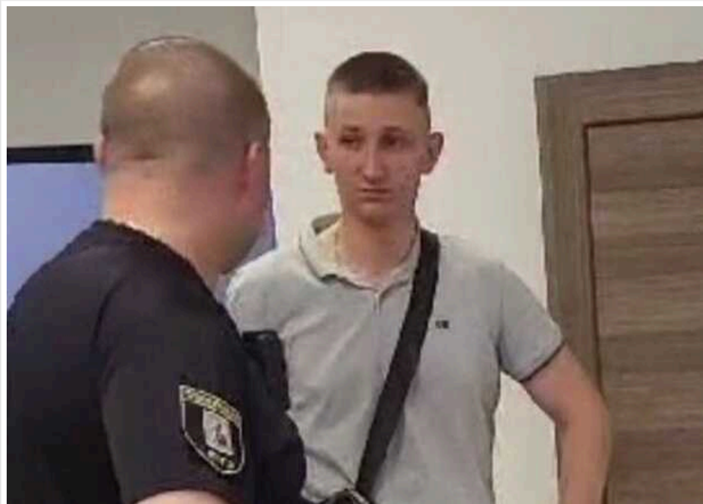
Скандал із Тищенком у Дніпрі: поліція Києва підтвердила участь свого співробітника в інциденті