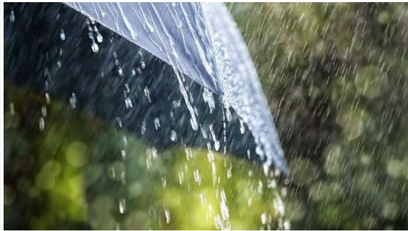
На Україну насувається сильна негода

У неділю, 23 червня, в Україні буде сильна негода. Синоптики повідомляють про грози та шквали у більшості областей.