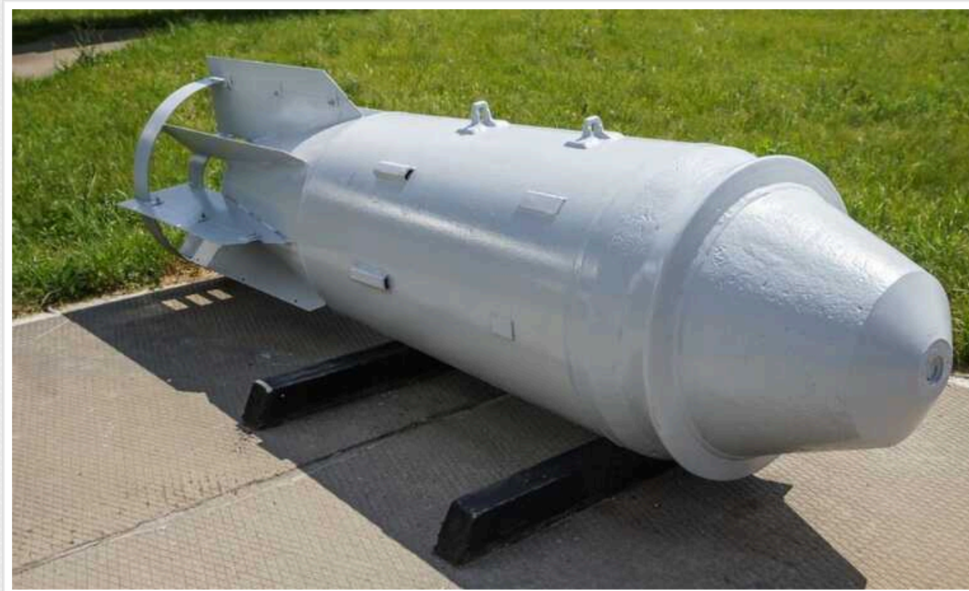
Окупанти вдарили ФАБ-3000 по Харківській області, - росЗМІ

Стверджується, що надпотужну авіабомбу знову скинули на Липці в Харківській області.