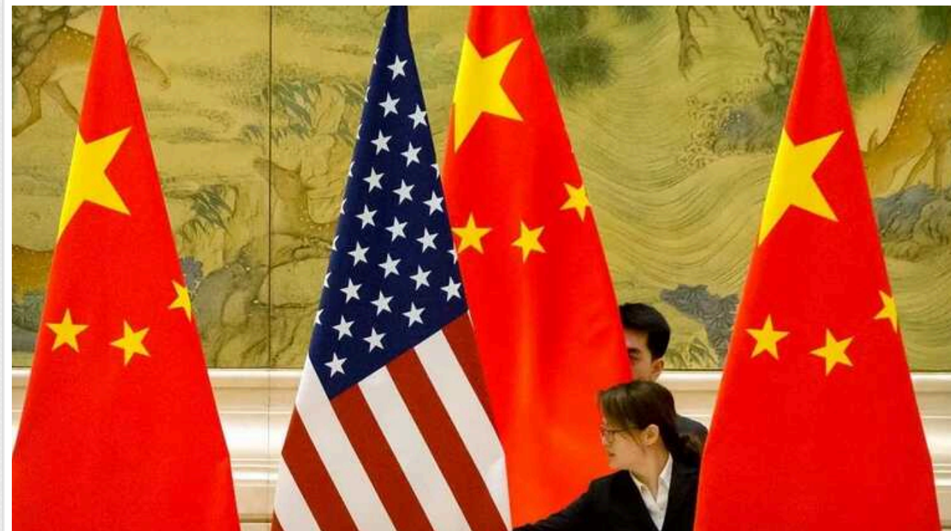
Reuters: США та Китай ведуть перші за п'ять років переговори щодо ядерної зброї

США та Китай вперше за п'ять років відновили напівофіційні переговори на рівні неурядових делегацій щодо ядерних озброєнь. Дводенні консультації відбулися у березні в конференц-залі одного з готелів у Шангаї.