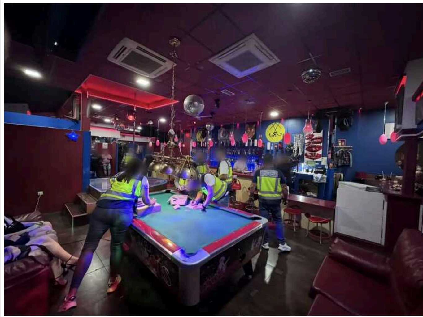
В Іспанії затримали злочинну групу, яку підозрюють у сексуальній експлуатації українок

В Іспанії було ліквідовано злочинну групу, яка займалася торгівлею людьми з метою їх сексуальної експлуатації. Ї жертвами стали громадянки України – їх заманювали обіцянками оформити для них візи біженців, надати фінансову підтримку та роботу.