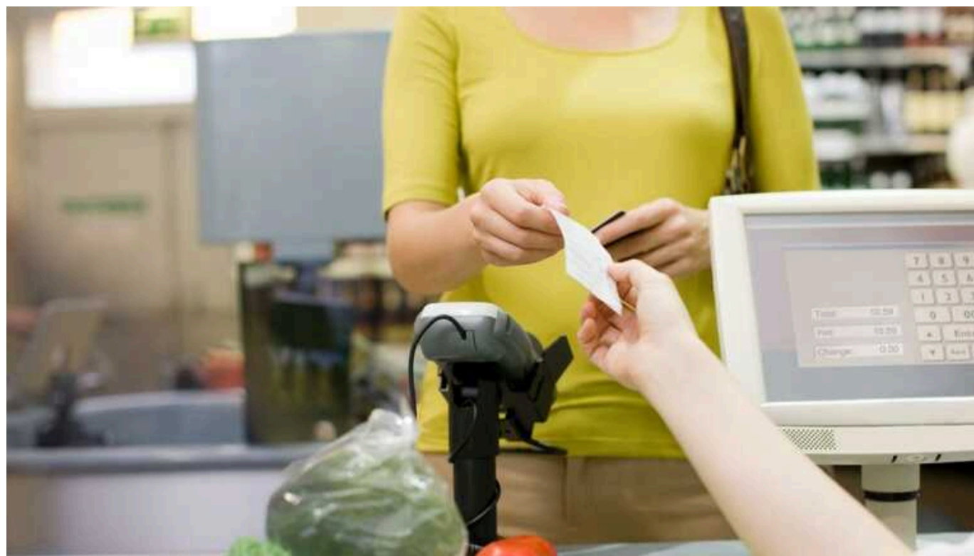
Програма "Купуй українське": оголошено дату запуску кешбеку за придбання товарів

Запуск програми кешбеку "Купуй українське" заплановано на 1 вересня 2024 року, наразі триває робота над нормативним документом. Програма передбачає компенсацію частини витрат на товари українських виробників для стимулювання економіки та підтримки місцевих виробників.