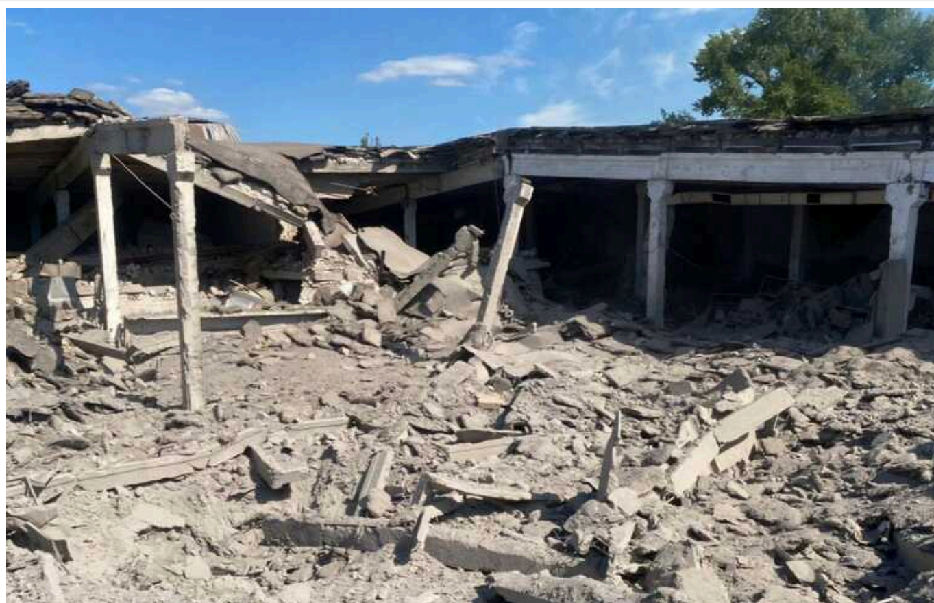
ЗС РФ атакували балістикою продуктові склади у Кривому Розі

У Кривому Розі вдень у п'ятницю, 21 червня, близько 15:40 пролунав вибух. Попередньо, окупанти запустили балістику; був пріліт по інфраструктурі та пожежа.