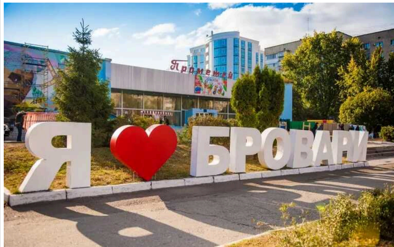
У Верховній Раді хочуть перейменувати місто Бровари на Броварі

Народний депутат Роман Лозинський пропонує перейменувати місто Бровари на Бровар.