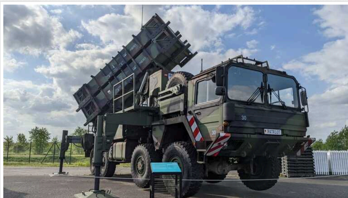
Нідерланди спільно з іншою країною передадуть Україні систему Patriot

Україна отримає ще один зенітний ракетний комплекс Patriot. Його передадуть Нідерланди спільно зі ще однією країною.