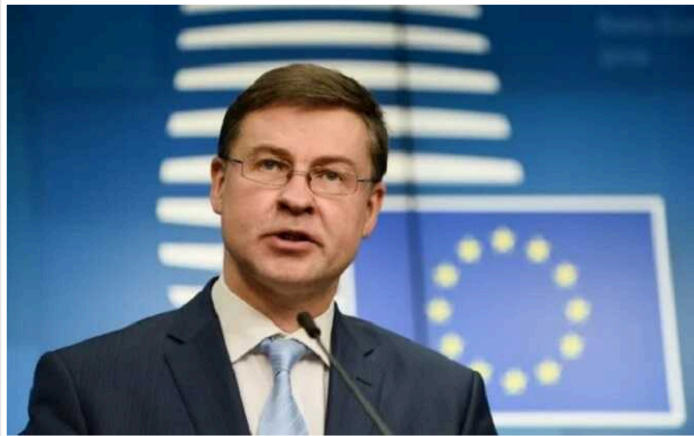
Наступного тижня Україна отримає 1,9 мільярдів євро від ЄС у рамках Ukraine Facility

Європейський союз надасть Україні 1,9 млрд євро вже наступного тижня. Допомогу передають у рамках програми на 50 млрд євро (Ukraine Facility).