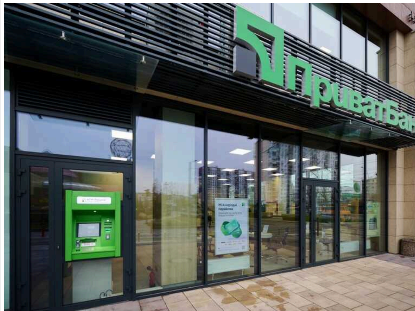
ПриватБанк на сім годин зупинить операції з карток і роботу банкоматів через регламентні роботи

Державний ПриватБанк оголосив, що 22 червня проводитиме регламентні роботи процесингу: операції з картами будуть на паузі з півночі до 7 ранку.